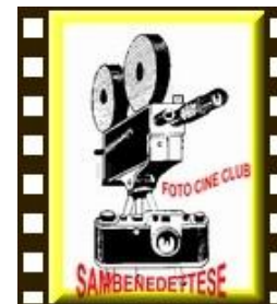
FOTO CINE CLUB SAMBENEDETTESE

Realizziamo un grande reportage sulla nostra città sulla nostra gente sulle nostre attività con immagini inedite e originali